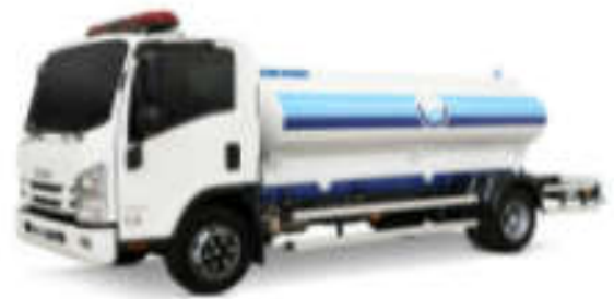
- کاربری تانکر حمل آب