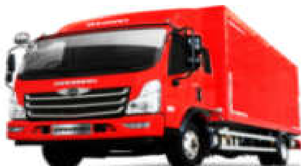
- کاربری ایزوله