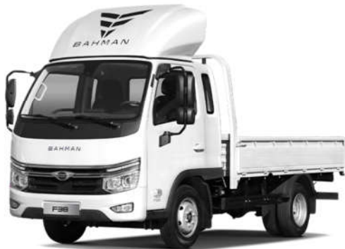
محصول فورس ۳.۸ تن