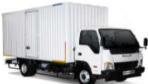
- کاربری مسقف فلزی