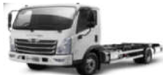
- کامیونت فورس ۶ تن