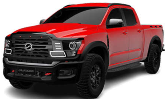
- مونتاز G9