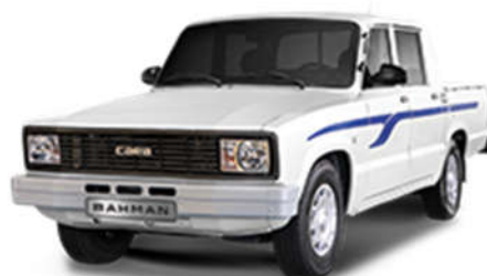
- مونتاز وانت کارا