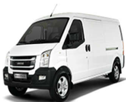
- مونتاز اینرودز