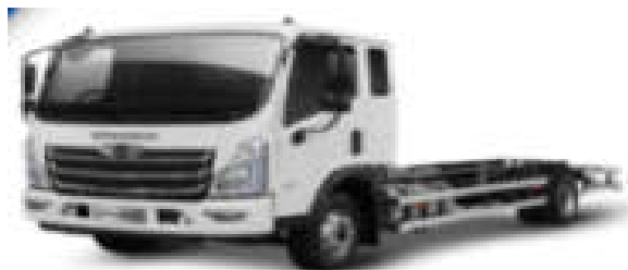
- کامیونت فورس ۶ تن (کابین خوابدار)