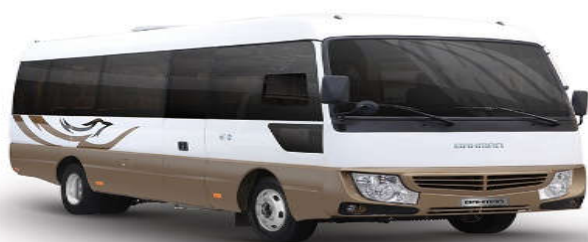
- مینی بوس سحر