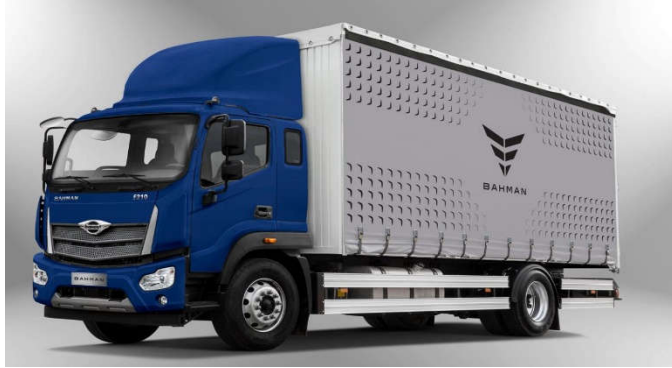
- کامیون فورس ۱۲ تن