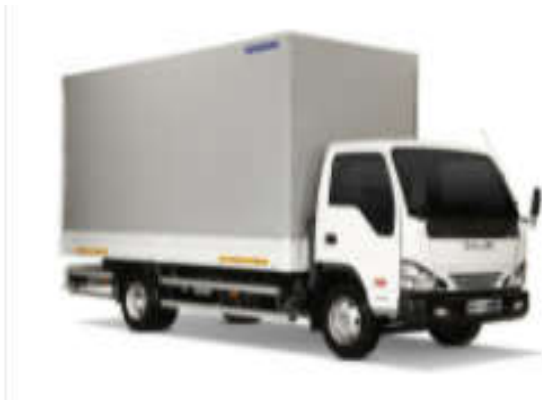
- کاربری مسقف چادری