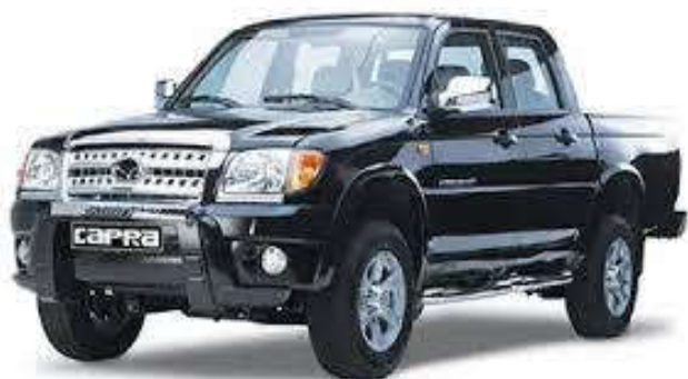
- مونتاز کاپرا