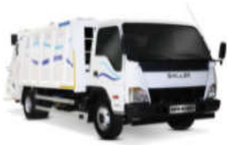
- کاربری حمل زباله