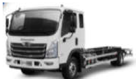
- کامیونت فورس ۸.۵ تن (کابین خوابدار)