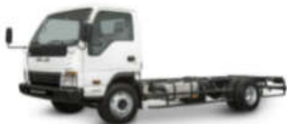
- کامیونت شیلر ۶ تن