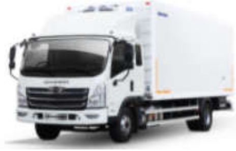
- کاربری یخچال