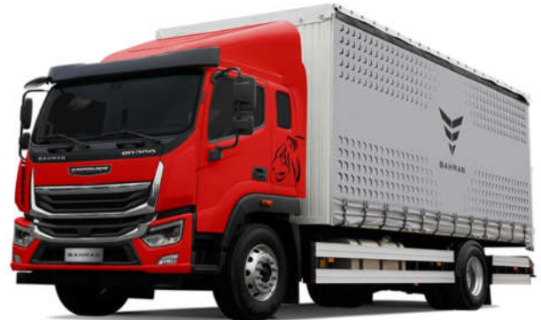
- کامیون BD۳۰۰