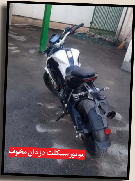
موتورسیکلت دزدان مخوف

به گزارش اختصاصی روزنامه خراسان، زورگیری های وحشتناک اعضای این باند آپاچی سوار، از حدود ساعت ۱۵ عصر هجدهم دی، زمانی زنگ پلیس ۱۱۰ را به صدا درآورد که پسر جوانی در منطقه قاسم آباد مشهد قصد داشت خواهر کوچکش را به مدرسه ببرد اما ناگهان ۲ جوان آپاچی سوار مقابلش توقف کردند و یکی از آن ها قهقه ای ترسناک را زیر گلوئی پسر جوان گذاشت و با تهدید به مرگ، گوشی تلفن او را ربود. هنوز ساعتی از این ماجرا نگذشته بود که چندین بار دیگر زنگ تلفن ۱۱۰ باز هم جیغ کشید و مال باختگان از زورگیری های ۲ جوان آپاچی سوار شکایت کردند که «موهای سیخی» داشتند. در حالی که تکاپوی پلیس برای شناسایی زورگیران آپاچی سوار آغاز شده بود، ناگهان خبر وحشتناک دیگری به پلیس گزارش شد. مرد جوانی که با ضربات قهقه دو جوان با «موهای سیخی» مجروح شده بود به نیروهای انتظامی گفت: ساعت حدود ۲۰:۳۰ شب به سمت منزلم در حرکت بودم که در خیابان بهار